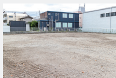
不動産所有・ モータープール 土地・駐車場・駐輪場