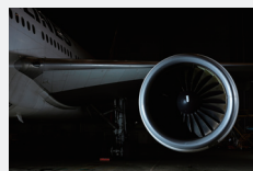
オルタナティブ 投資事業 航空機リース