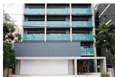
居住用資産事業 マンション・共同住宅・ 分譲マンション