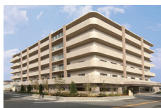
福祉・教育・ 保育関連施設事業 老人ホーム・ 障害者施設・保育園