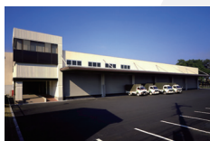
事業用資産・ テナント事業 大型テナントビル・ 倉庫・店舗型住宅